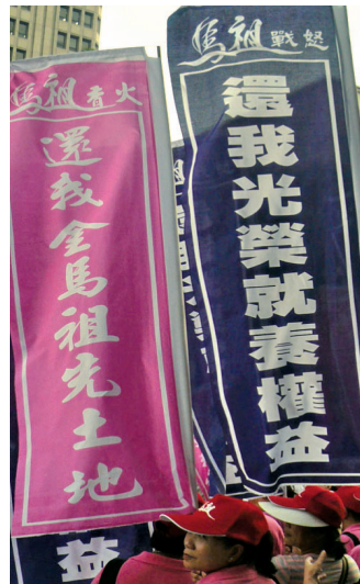
圖 4 本次活動兩款旗幟

遊行當天集合時間兩點時下起了大雨，三點過後天空逐漸放晴。凱達格蘭大道上搭建的舞台，飄盪著藍色與粉紅色的旗幟，上面寫著「馬祖戰怒 還我光榮就養權益」、「馬祖香火 還我金馬祖先土地」（圖 4）。