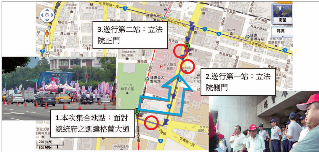
圖 3 823 實際遊行路線圖

伍先到了立法院側門群賢樓，後來發現此處並非正門後，有人提議繼續前往立法院正門抗議。以下是當日真正遊行的路線（圖 3）：