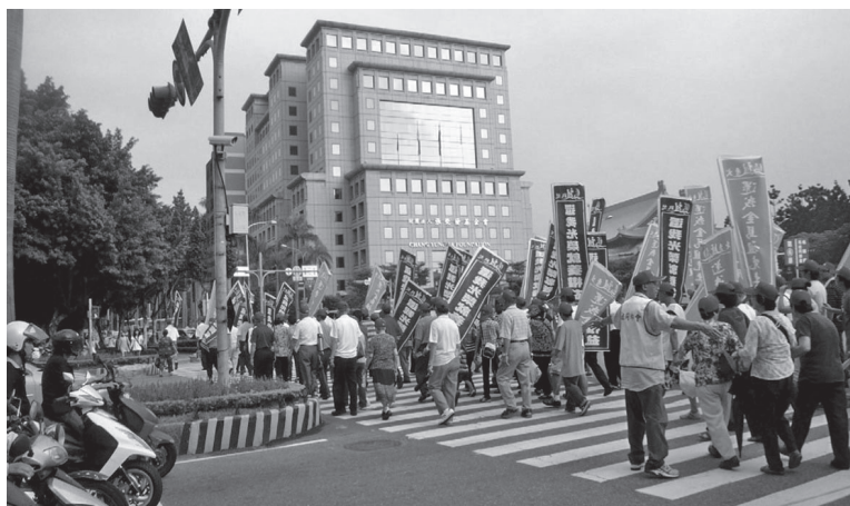
圖 9 從總統府前離開，前往立法院的遊行隊伍

遊行民眾前往立法院，首先到達立法院的側門。一些警察早已在那裡駐守。馬祖人相當有秩序的舉起大旗，喊著「還我祖先土地」。有幾位帶頭的人發現走到的是立法院側門，抓起麥克風大聲的喊話「為什麼馬祖人要這麼委屈？為什麼容忍了這麼多年卻不能到立法院的正門表達意見？難道我們只能跟小媳婦一樣在側門嗎？」「鄉親們，我們到立法院正門，叫曹爾忠出來跟大家解釋阿！」「曹爾忠為什麼不敢出來？是不是做了什麼對不起我們的事情？」在這幾位人士的鼓動之下，許多民眾開始大聲嚷嚷著到立法院正門，一時之間場面譁然。由於這並非原有的遊行路線，前縣長陳雪生緩緩拿起麥克風，以馬祖話再度發言「鄉親阿，立法院正門已經有其他團體了，我們要守法阿！堅持到正門只會模糊焦點，鄉親阿，守法阿！」然而，激動的民意已無法用言語平復，大家不顧一切的高舉大旗，往立法院正門邁進，希望曹爾忠立委能出來給一個交代。立法院正門大批駐守的警力，看到馬祖人高漲的情緒，也拿出了盾牌與警棍，但民眾卻遲遲不見立委曹爾忠。只見領導人士拿著麥克風大聲呼喊「曹爾忠，滾出來！」，陳財能也憤慨的對著立法院正門大吼「中國國民黨出來道歉！」前縣長陳雪生則試圖緩和民眾的情緒，他拿起了麥克風，對馬祖人民表示「鄉親阿！曹爾忠已答應接受陳情，有十位可以進入立法院遞交」。最後，由陳雪生走進立法院與曹爾忠協商後，才由王國棟代表，將陳情書遞交立法院（由國民黨黨團副書記賴士葆立委代表接受）(admin 2011/08/23)。整個活動大約在下午五點二十分結束，大部分的民眾